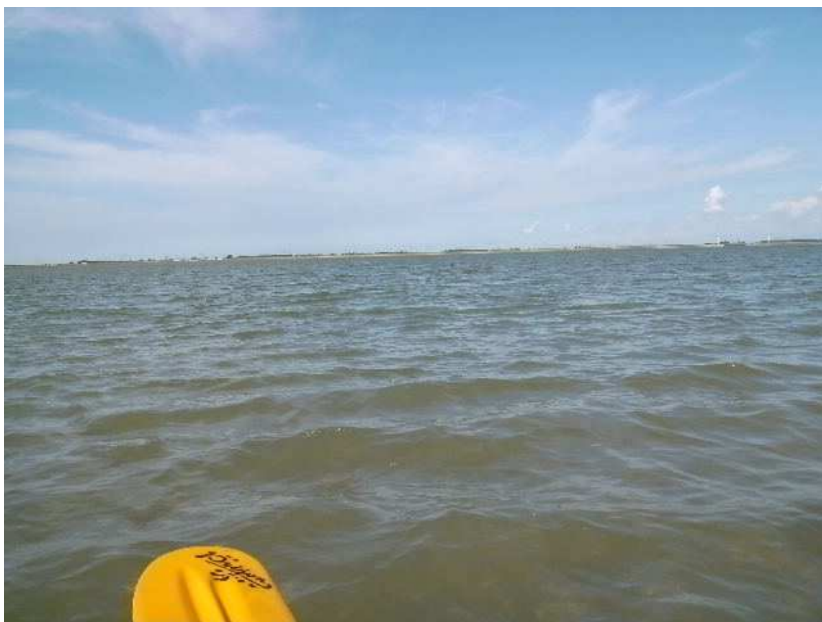
Misschien inzenden voor NATURE ?? Natuurfoto van het jaar of zo ;-) ??

Ondertussen werd de zandbank wat minder hard, een zacht modderlaagje maakte het lopen wat moeilijker maar niet echt een probleem. Op enig afstand lagen een tien/vijftien zeehonden op een ondertussen aan de oppervlakte verschenen zandbank. Het leek er ondertussen op dat ik wat dieper water naderde zodat ik terug kon instappen. Dat lukte met een gewone zijdelingse paddelsteun wat aangeeft dat het zeker niet diep was daar. Ter hoogte van de zeehondjes bleken die de zaak niet langer te vertrouwen en haastten ze zich naar het water om dan als een verspreide hoop zwarte ballen rond mij te gaan liggen. Hun hoofdjes draaiden snel van mij naar hun naaste buur en bij de eerste die onderdook verdwenen ze allemaal in een flits. Als echte natuurfotograaf heb ik dat moment vastgelegd natuurlijk. Dat zal niet alleman lukken.